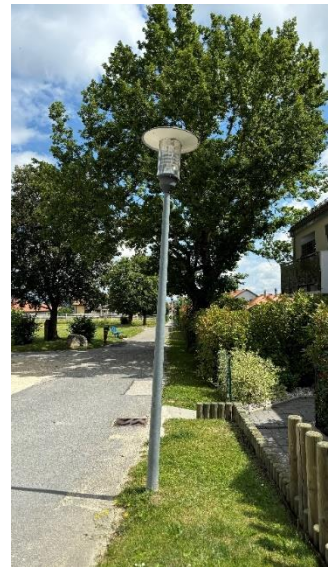
Photo des luminaires existants

Les 9 luminaires existants situés sur le chemin des Ecoliers sont de source sodium ou mercure de puissance 70W. Ces sources sont d'ancienne génération et très énergivores. La nuit, la luminosité de ces points lumineux ne peut pas être réduite, ni même éteinte.