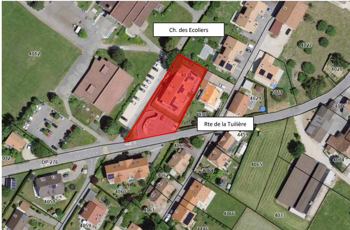
Localisation de la parcelle concernée

Depuis la création de la PPE Clos Vert en 2021/2022 et durant les périodes de fortes précipitations, l'eau pluviale refoule par les caniveaux en bas de la rampe d'accès au parking souterrain située à la route de la Tuilière 4 à Pampigny et inonde ainsi le garage, les caves et les locaux techniques.