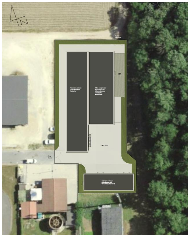
Figure 2: Plan de situation de l'avant-projet de STEP intercommunale sur le site de Vullierens

Le site retenu de Vullierens, situé sur les parcelles RF n°391 (propriété de la commune de Vullierens) et n°392, réunit l'ensemble des critères ci-dessus. Il est situé actuellement en zone d'activités économiques. L'avant-projet prévoit d'utiliser la partie Est de la parcelle (emprise du futur DDP de 2'000 m 2 ).