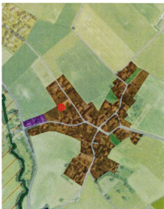
guichet cartographique cantonal, échelle 1:10'000

Extrait du plan d'affectation communal issu du